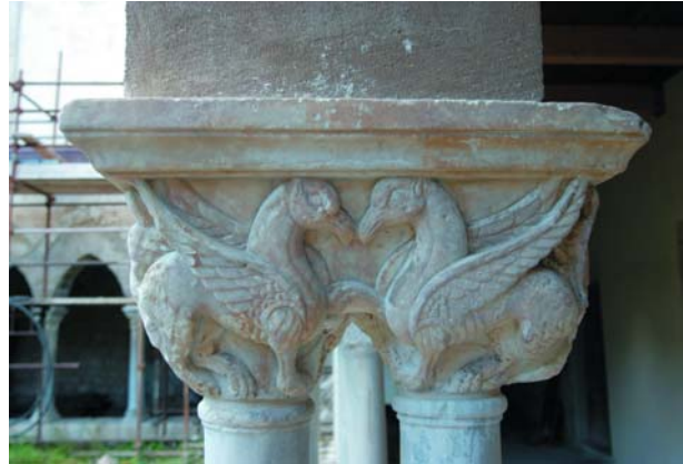
Capitello con grifi alati nel chiostro di Cefalù.

Le delicate questioni connesse alla restituzione delle cromie originarie (mi riferisco anche alla grana ed alla texture delle finiture) e, al contempo, alla conservazione della patina, cioè di quell'aura speciale peculiare delle opere del passato, rivestono un ruolo di