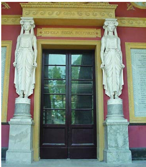
L'ingresso dell'Orto Botanico

galleria aux glaces , che prende il nome dal pittore Gioacchino Martorana, è illustrata un'allegoria sui temi del piacere e della vita , riproposta anche dalle scene di ispirazione bacchica che animano il raffinato pavimento maiolicato.